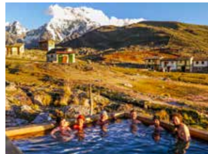
In den Thermalquellen von Pachanta

Eine Bezahlung Ihrer Flugreise mit Kreditkarte ist spesenfrei nach vorheriger Absprache mit Clearskies möglich. Wir benötigen Ihre Kreditkartendaten VOR Ticketausstellung, da der Flug nachträglich nicht mehr über die Kreditkarte abgebucht werden kann.