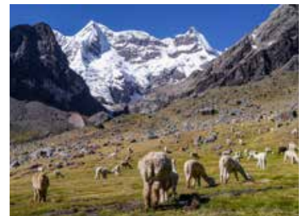
Alpacas im Ausangate Massiv