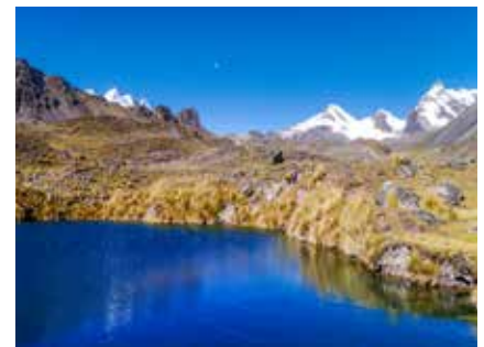
In der Cordillera Real

Vegetarische Verpflegung ist kein Problem, bitte um entsprechenden Hinweis bei Buchung.