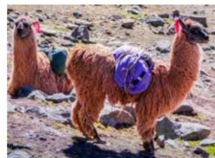
Llamas sind die traditionellen Lasttiere