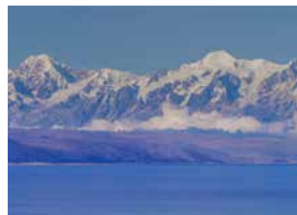
Titicacasee und Cordillera Real