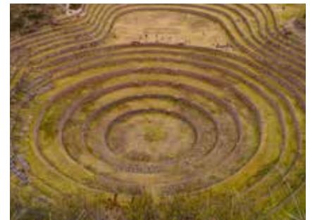
Die Inka-Anlage Maras