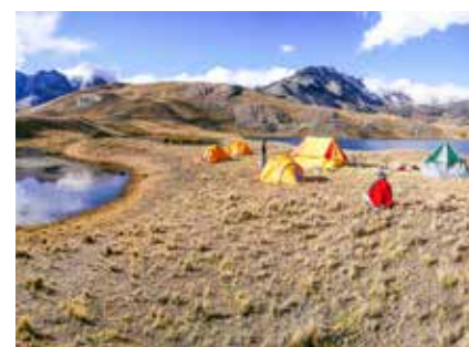
Zeltlager in der Cordillera Real