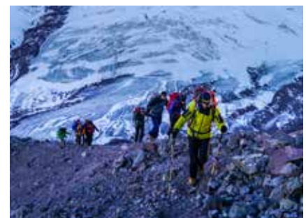
Im Aufstieg zum Hampa