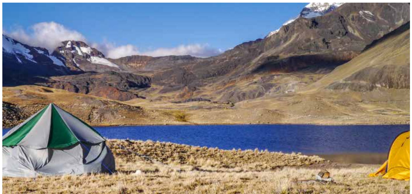
Der Blick aus dem Zelt, links im Bild das Küchenzelt