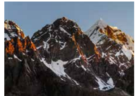
Im Ausangate Massiv

Gerne können wir bei Bedarf einen Bergführer für geführte Bergtouren vermitteln.