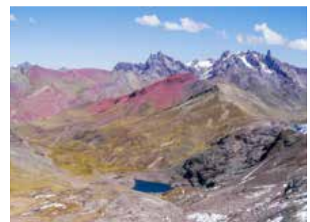
Farbenpracht im Ausangate-Massiv