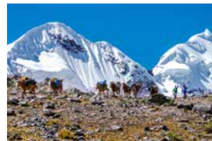
Gewaltige Hängegletscher im Ausgangate

Am besten geeignet für Outdoor-Aktivitäten ist die Zeit zwischen Anfang Mai und Anfang Oktober, dem peruanischen Winter, der zugleich trockensten Periode des Jahres. Das Wetter ist dann zumeist stabil und sonnig, wenn auch in höheren Lagen etwas kühl. Die Tagestemperaturen betragen in etwa 15-20°C, während es in der Nacht auf unter 0°C abkühlen kann.