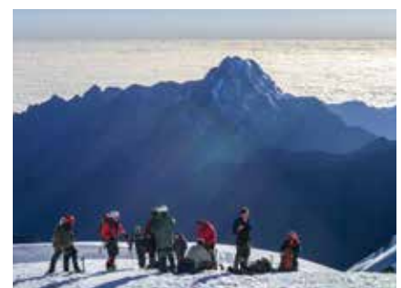
Am Huayna Potosi