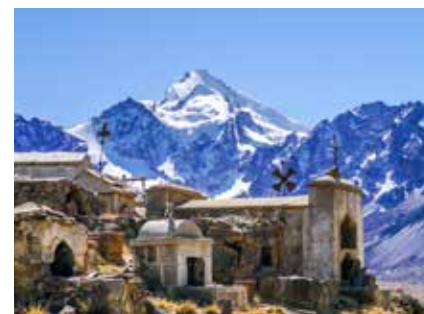
Friedhof bolivianischer Minenarbeiter