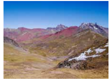
An der Südseite der Cordillera Vilcanota