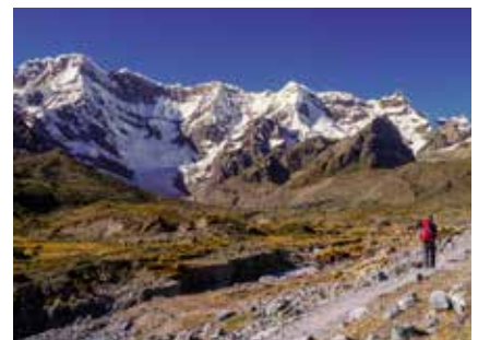
Im Ausangate Massiv