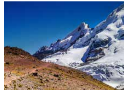
Beeindruckende Cordillera Vilcanota