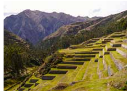
Terassenlandschaft – Erbe aus der Inkazeit