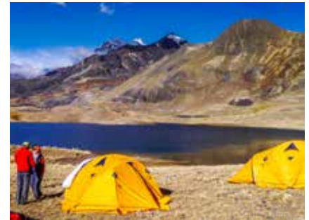
Lager in der Cordillera Real