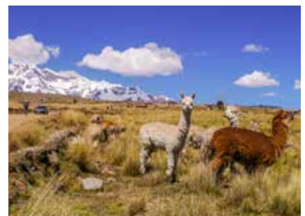
Alpacas im Ausangate Massiv