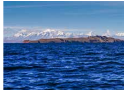
Titicacasee und Cordillera Real