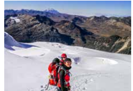
Abstieg vom Huayna Potosí