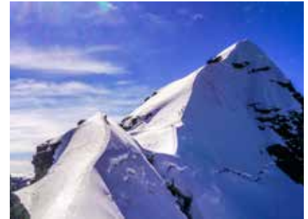
Der Pequeño Alpamayo

Nur mit entsprechender Höhenakklimatisierung lassen sich die lohnenden Bergziele unserer Reise – Hampa (5350 m), bzw. Tarija (5350 m) und Huayna Potosí (6088 m) – erreichen und die gesamte Tour genießen.