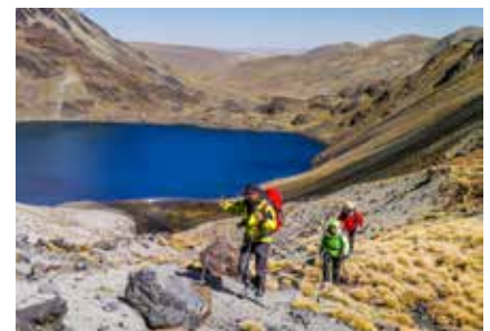
Aufstieg zum Pico Austria

Die Gruppe startet nach dem Frühstück so gegen 8 Uhr 30 in die Tagesetappe. Am Vormittag planen wir 4 bis 5 Stunden Gehzeit, regelmäßig mit kurzen Trink- und Fotopausen unterbrochen, auch um die gewaltige Landschaft zu genießen. Steht z.B. eine Passquerung am Programm, haben wir Zeit für eine entsprechende Rast. Zu Mittag wird je nach Tagesetappe entweder ein mitgenommenes Lunchpaket verzehrt.