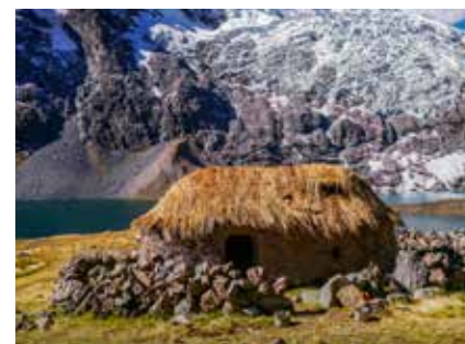
An der Südseite des Ausgangate-Massif