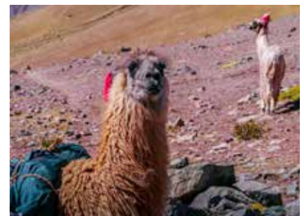
Quasten machen Alpacas dem Besitzer zuordenbar