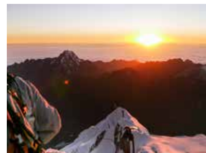
Sonnenaufgang am Gipfel des Huayna Potosí