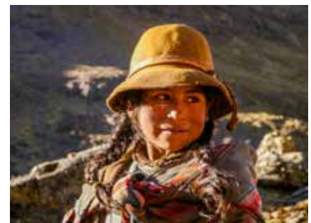
Hirtinmädchen im Ausgangate