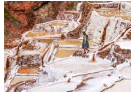
Salzterassen von Moray im heiligen Tal