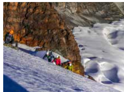
Gipfelflanke am Pequeño Alpamayo