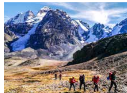
In der Cordillera Real