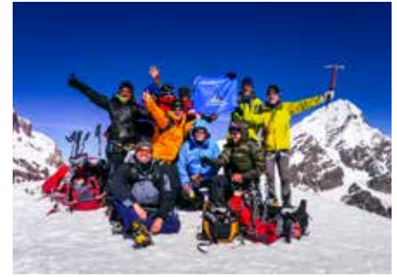
Am Gipfel des Pico Tarija

Teilweise werden Euro akzeptiert, allerdings zu schlechteren Kursen. Kreditkarten, v. a. Visa, werden inzwischen vielerorts akzeptiert und mit Kredit- oder Maestro-Karte kann man in allen größeren Städten Geld in der Landeswährung abheben. Während der Reise benötigt man hauptsächlich Kleingeld, da in kleineren Läden und auf Märkten aufgrund eines Mangels an Wechselgeld keine größeren Scheine akzeptiert werden.