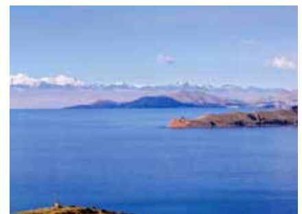
Lago Titicaca - im Hintergrund die Cordillera Real