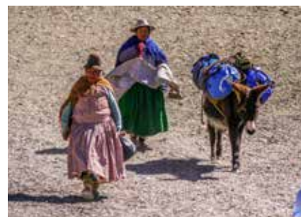
Cholitas - Traditioneller Stil verheirateter Frauen