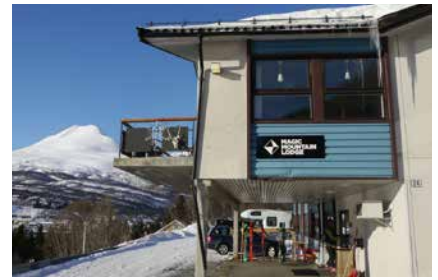
Magic Mountains Lodge in Lyngseidet

Im Norden von Norwegen bestehen auch im März noch gute Chancen, Nordlichter beobachten zu können. Die besten Voraussetzungen sind kaltes, trockenes Wetter und ein klarer Himmel!