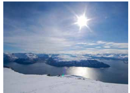
Die Lyngen Alps von oben