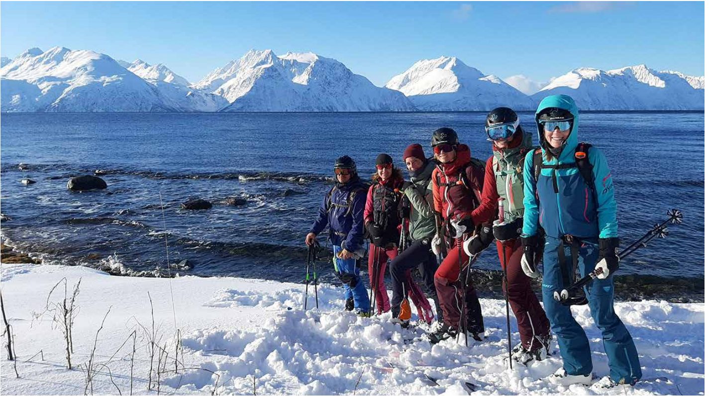
Abfahrt bis zum Meer - in den Lyngen Alpen