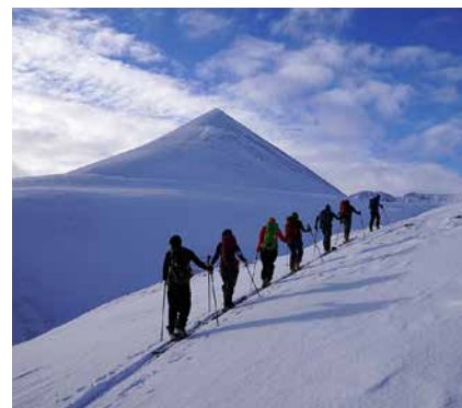
Skitour auf den Kvalvikfjellet

Die Mitnahme Haarscheisen (und ev. Steigeisen) sowie Erfahrung damit wird erwartet.