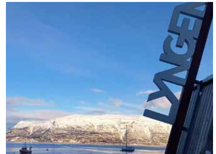
Sonnenuntergangsstimmung im Fjord