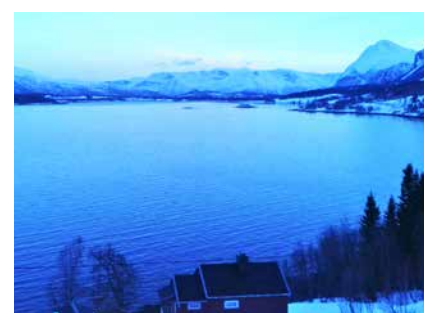
Abendlicher Ausblick von der Lodge