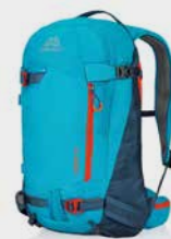
Targhee 26 L

Falls Sie einen Airbag Rucksack (ABS) mitnehmen möchten, informieren Sie uns bitte rechtzeitig, damit wir diesen bei der Fluglinie anmelden können. Planen Sie für den Check-In und die Security Kontrollen aber trotzdem etwas mehr Zeit ein.