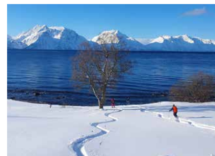
Pulverabfahrten bis in den Fjord