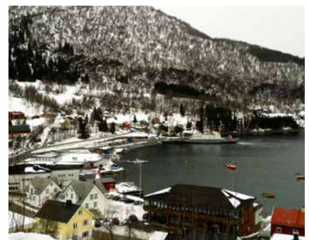
Blick auf Lyngseidet