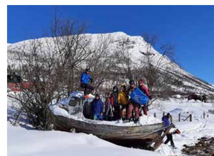
Ende der Skitour