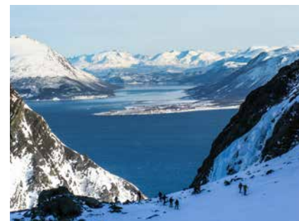
Gewaltige Tiefblicke in den Lyngen Alps

Nachdem Norwegen kein EU-Mitglied ist, kann nicht mit Euro gezahlt werden. Offizielle Währung in Norwegen ist die Norwegische Krone, mit demzeitigem Kurs von ca. 1,-€ = ca. 11 NOK. Wir empfehlen die Mitnahme einer Kreditkarte oder (ev. Bankomatkarte - wird u.U. nicht überall akzeptiert). In Norwegen wird fast alles mit Karte bezahlt! Bargeld wird teilweise nicht oder nur ungern akzeptiert!