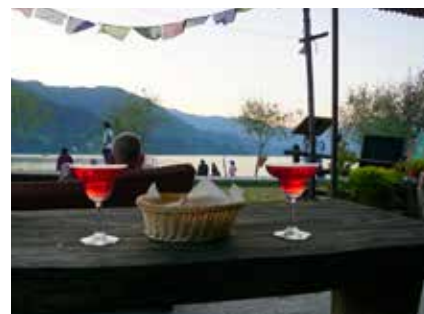
Abendstimmung am See in Pokhara