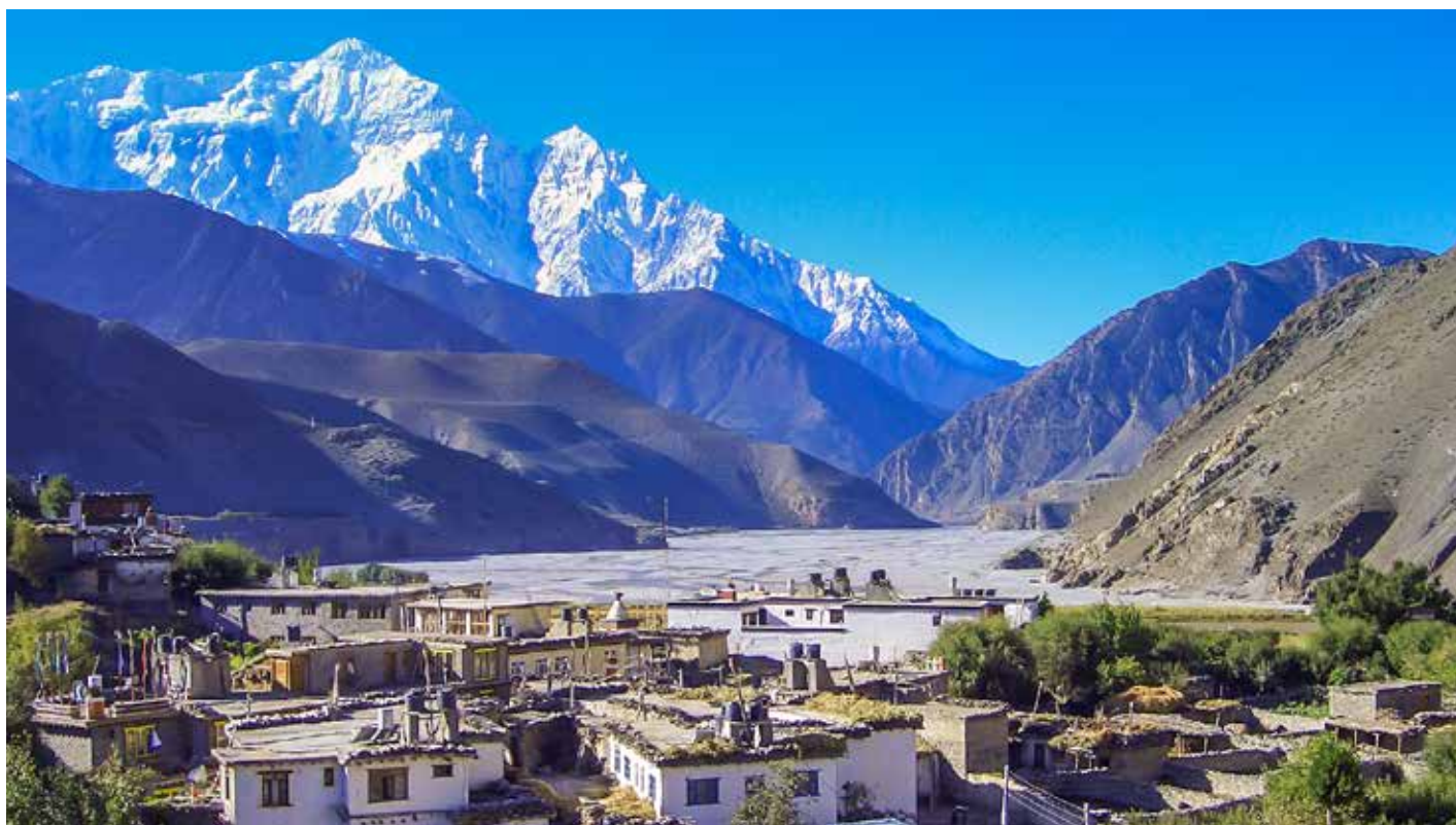
Kagbeni - das Tor zum verbotenen Königreich Mustang