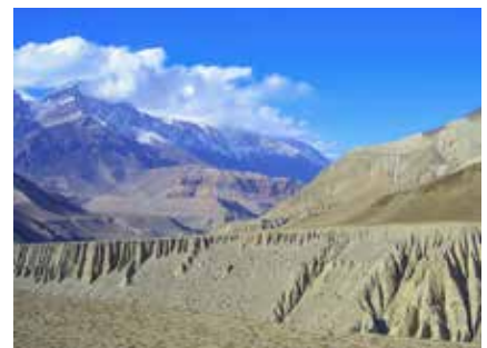
Karge Berglandschaften des Mustang