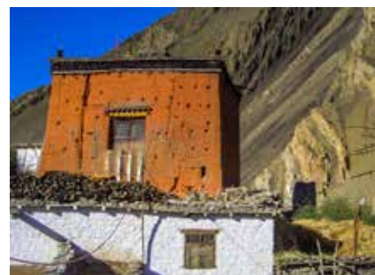
Die alte Gompa von Kagbeni