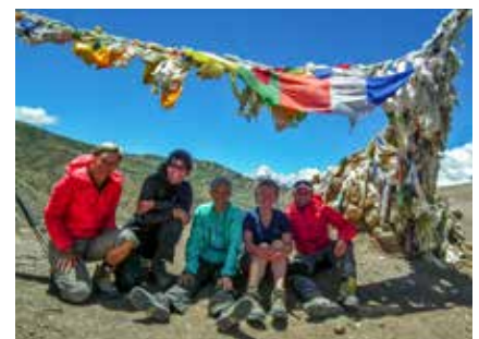
Gebetsfahnen auf der Passhöhe