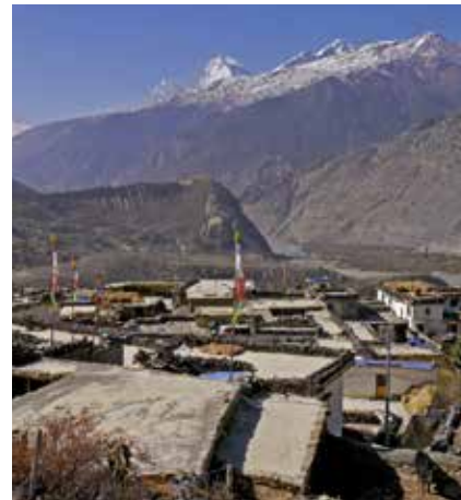
Im Hintergrund der Dhaulagiri...

Bitte lassen Sie sich in jedem Fall von Ihrem Arzt beraten.