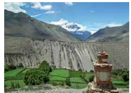
Üppige Felder inmitten karger Berglandschaften