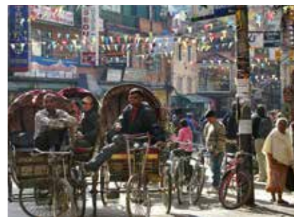
Riksha-Fahrer in Kathmandu