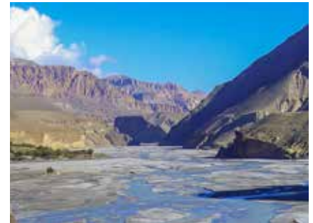
Das breite Flussbett des Kali-Gandaki

Anfang März beginnt auch in Nepal der Frühling, der bis Ende Mai eine sehr lohnende Reisesaison ist: warme Temperaturen und aufblühende Vegetation locken viele Trekker an. Wer die unbeschreiblich üppige Farben- und Blütenpracht im Frühling erlebt hat, nimmt auch die etwas diesigere Luft in Kauf. Speziell die faszinierende Rhododendron-Blüte (Baumhohe Alpenrosen) die mit ihrer Blütenpracht von Weiß über zartes Rosa bis ins Dunkelrot leuchten sollte jeder Bergfreund erlebt haben!