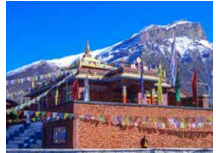
Das Kloster von Kagbeni