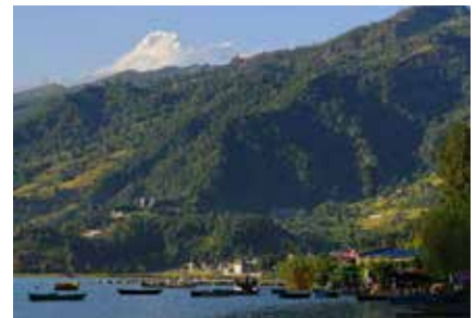
Malerische Stimmung in Pokhara