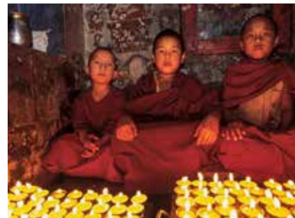
Novizen beim Unterricht

Auf der Trekkingtour benötigt man ebenfalls Kleingeld! Nehmen Sie ein paar kleine Rupien-scheine mit (NPR 50/100,-).