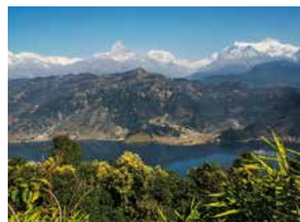
Phewa-See und Annapurna Massiv