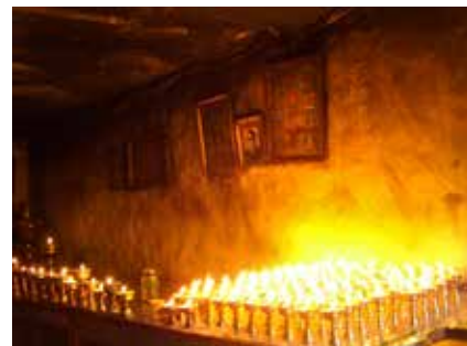
Butterlampen in der Gompa