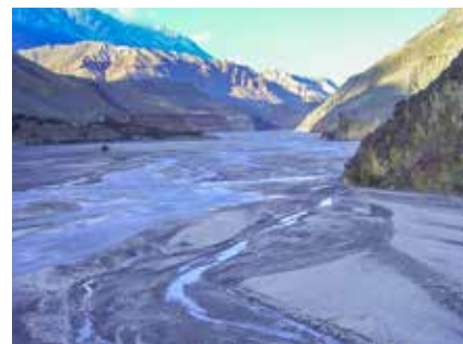
Das breite Tal des oberen Kali-Gandaki

Je nach Tagesetappe und Gegebenheiten kann dieser Zeitplan natürlich abweichen.