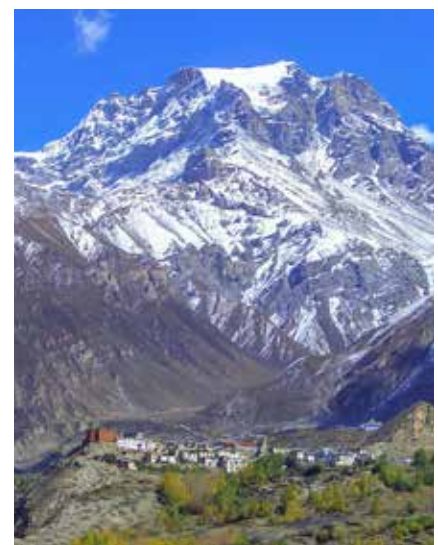
Jharkot, bei Muktinath

Bitte beachten Sie, dass Nepal eines der ärmsten Länder der Welt ist! Die gesamte Infrastruktur des Landes kann nicht mit Europa verglichen werden. Auch gibt es starke kulturelle Unterschiede, die bei einer erstmaligen Reise nach Nepal durchaus überraschend, bzw. fordernd sein können. Wir erwarten von unseren Mitreisenden Offenheit und Toleranz gegenüber der fremden Kultur und den Religionen Nepals und auch entsprechende Gelassenheit, falls Umstände und (zeitliche) Abläufe in Nepal nicht den europäischen Vorstellungen entsprechen, bzw. schwer nachvollziehbar sind.