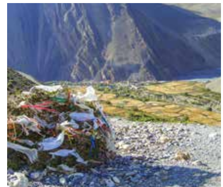
Die terrasierten Felder von Kagbeni