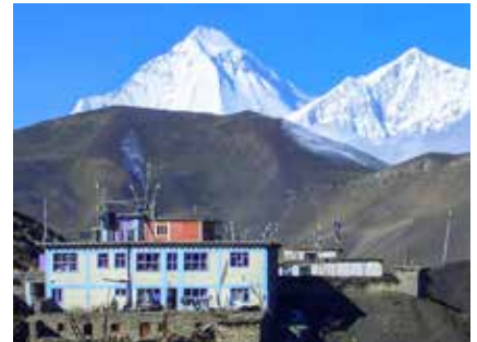
Im Hintergrund der mächtige Dhaulagiri