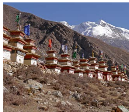
Klosteranlage bei Phu