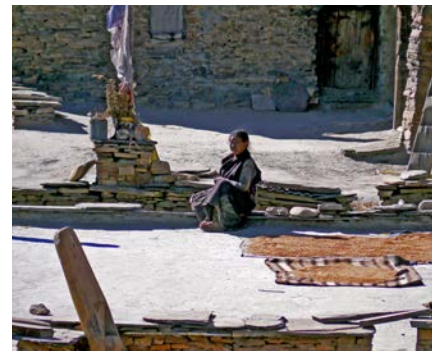
Dorfleben in Naar