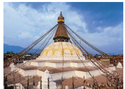
Die Stupa von Buddha Nath in Kathmandu

In den meisten Lodges gibt es die Möglichkeit einer warmen Dusche (gegen geringe Gebühr von € 2–3,-). WC (Hocktoilette) und Waschgelegenheiten (Brunnen bzw. Wasser-schlauch im Freien) entsprechen meist nicht dem westlichen Standard.