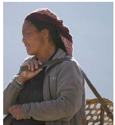
Bewohnerin des Dorfes Naar

Mit der Überschreitung des ersten Passes starten wir in den konditionell anspruchsvollen Teil der Tour.