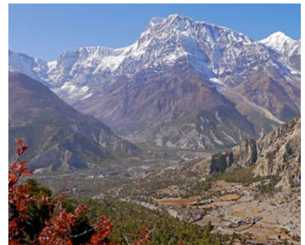
Das obere Tal des Marsyangdi

Kreditkartenzahlung: Die Bezahlung Ihrer Reise mit Kreditkarte ist prinzipiell möglich. Bitte beachten Sie, dass hier teilweise Spesen entstehen können. Bitte kontaktieren Sie uns diesbezüglich telefonisch.