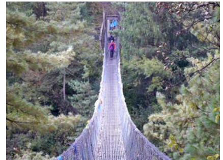
Auf der langen Hängebrücke über den Marsyangdi