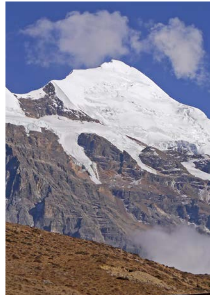
Blick auf den Kang Guru

Bitte lassen Sie sich in jedem Fall von Ihrem Arzt beraten.