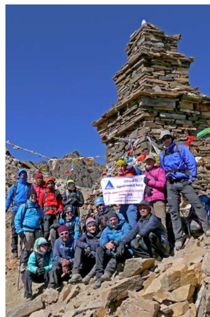
Am Kang La Pass