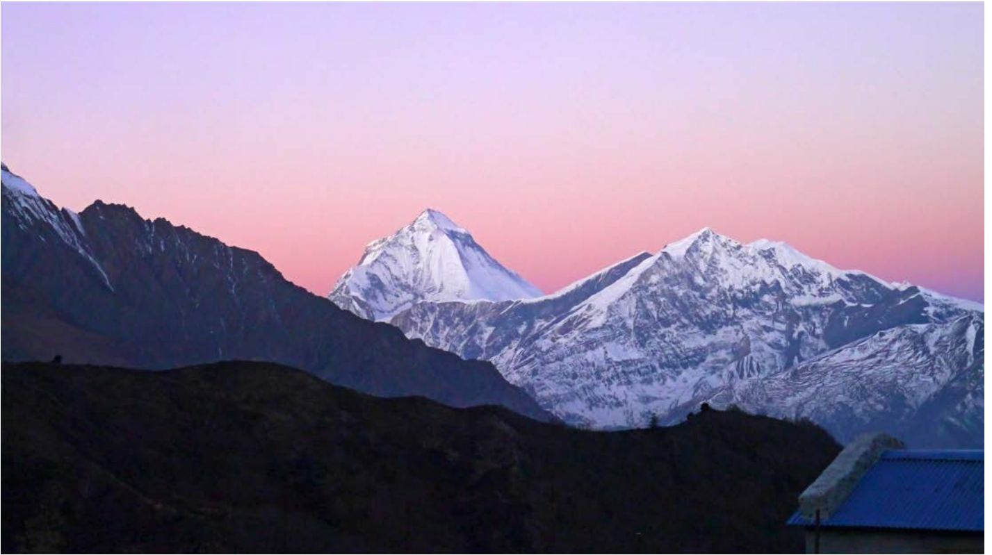
Der Dhaulagiri (8167 m) bei Sonnenaufgang

Auf abgelegenen Pfaden um das Annapurna-Massiv mit Ausflug zum Tilichosee