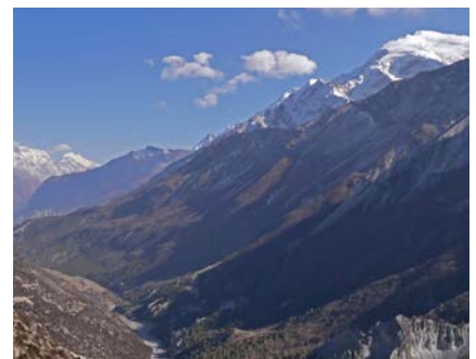
Blick zurück nach Manang