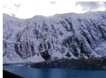
Am Tilicho See