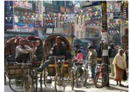
Riksha-Fahrer in Kathmandu