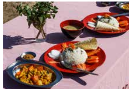
Typisch nepalesische Mahlzeit