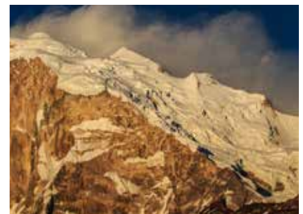
Annapurna zum Greifen nahe...