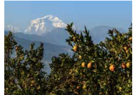
Das Annapurna-Massiv