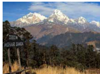
Am Aussichtspunkt Mohare Danda

Snacks, Schokolade, Riegel usw. sind nicht inkludiert und müssen von den Teilnehmern selbst mitgebracht bzw. können zum Teil vor Ort gekauft werden.