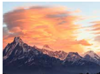
Machhapuchhre - Fish Tail Peak