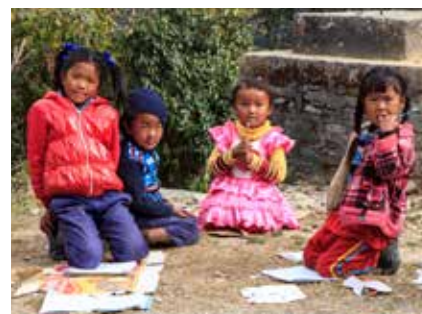
Nepalesische Schulkinder