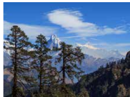
Blick auf den berühmten Machhapuchhre

Bitte beachten Sie, dass Nepal eines der ärmsten Länder der Welt ist! Die gesamte Infrastruktur des Landes kann nicht mit Europa verglichen werden. Auch gibt es starke kulturelle Unterschiede, die bei einer erstmaligen Reise nach Nepal durchaus überraschend, bzw. fordernd sein können. Wir erwarten von unseren Mitreisenden Offenheit und Toleranz gegenüber der fremden Kultur und den Religionen Nepals und auch entsprechende Gelassenheit, falls Umstände und (zeitliche) Abläufe in Nepal nicht den europäischen Vorstellungen entsprechen, bzw. schwer nachvollziehbar sind.