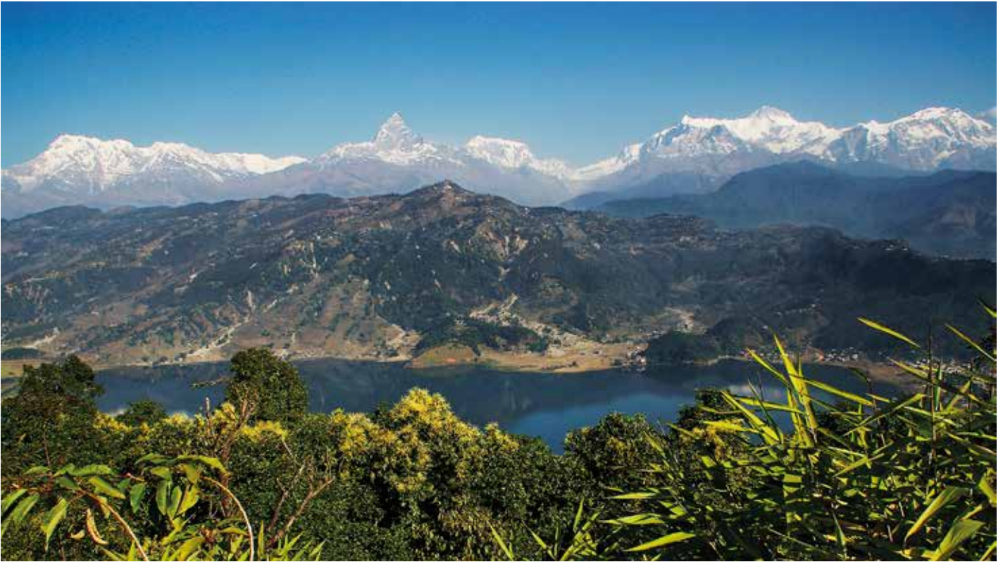
Ausblick über den Phewa-See auf die Südseite der Annapurna-Kette

Lodge-Trekking zu den schönsten Aussichtspunkten an der Annapurna