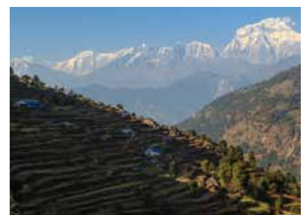
Dhaulagiri Himal