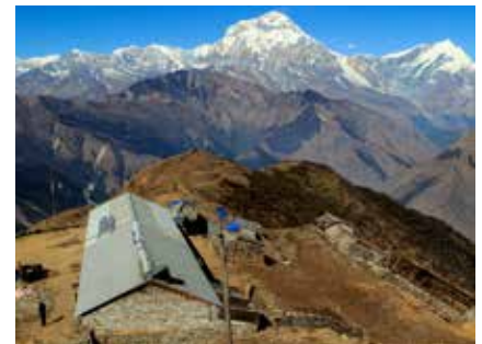
Lodge in Khopra Danda