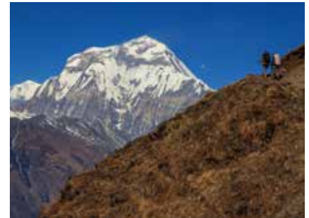
Sherpas beim Aufstieg

Anfang März beginnt auch in Nepal der Frühling, der bis Ende Mai eine sehr lohnende Reisesaison ist: warme Temperaturen und aufblühende Vegetation locken viele Trekker an. Wer die unbeschreiblich üppige Farben- und Blütenpracht im Frühling erlebt hat, nimmt auch die etwas diesigere Luft in Kauf. Speziell die faszinierende Rhododendron-Blüte (Baumhohe Alpenrosen) die mit ihrer Blütenpracht von Weiß über zartes Rosa bis ins Dunkelrot leuchten sollte jeder Bergfreund erlebt haben!