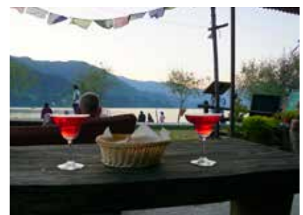
Abendstimmung am See in Pokhara