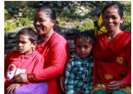
Nepalesische Familie