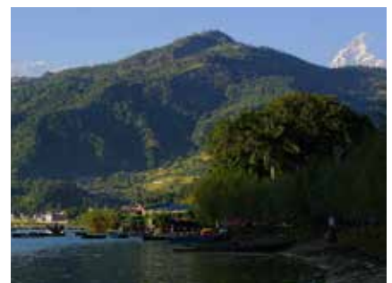
Am Phewa See bei Pokhara

Kreditkartenzahlung: Die Bezahlung Ihrer Reise mit Kreditkarte ist prinzipiell möglich. Bitte beachten Sie, dass hier teilweise Spesen entstehen können. Bitte kontaktieren Sie uns diesbezüglich telefonisch.