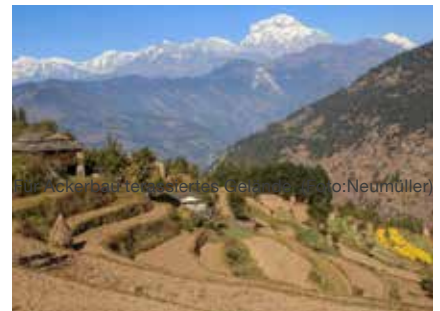
Das Annapurna-Massiv