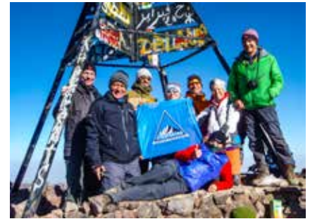
Am Gipfel des Toubkal