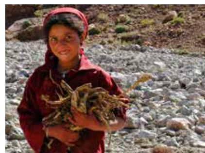
Berbermädchen beim Sammeln von Brennholz

Sie können bei den Geldwechselschaltern am Flughafen wechseln, in Marrakesch bleibt dafür aber auch noch ausreichend Zeit. In größeren Städten kann man auch am Bankomaten Geld beheben. Bitte prüfen Sie, ob Ihre Bankomatkarte fürs Ausland freigeschaltet ist (GeoControl). Der Kurs ist in ganz Marokko identisch.