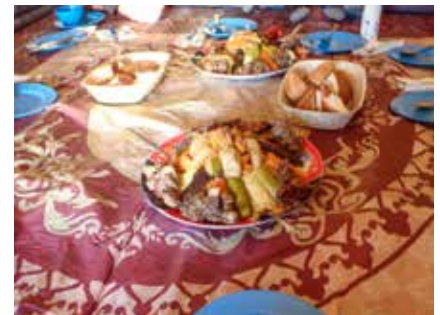
Mahlzeit im Berberzelt

Ein Begleitfahrzeug (Jeep) steht den Teilnehmern ständig zur Verfügung und somit können die Etappen bei Bedarf individuell verkürzt werden.