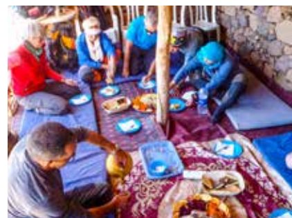
Tee-Zeremonie vor dem Mittagessen

In Marrakesch erwarten Sie um die 25°C. In der Wüste kann es untertags heiß sein, aber speziell am Abend nach Sonnenuntergang wird es kalt werden. Denken Sie beim Packen daher an einen guten Sonnenschutz, aber auch an warme Kleidungsstücke (Handschuhe, Mütze, Thermo-Unterwäsche). Unsere Ausrüstungsliste liefert gute Tipps für das Reisegepäck.