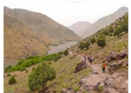
Abstieg nach Imilil

Kunden aus der Schweiz können unsere CHF-Kontoverbindung in der BTV Staad (Schweiz) spesenfrei nutzen.