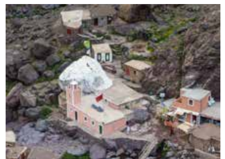
Der Wallfahrtsort Sidi Chamarouch