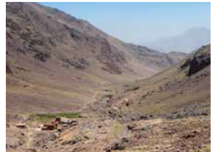
Blick auf die Toubkal-Hütten