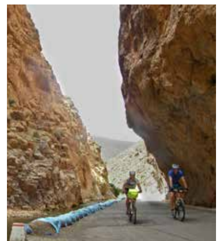
In der Dades-Schlucht