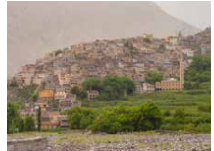
Das Bergdorf Imilil