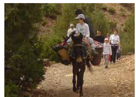
Ein zusätzliches Reittier für die Kinder begleitet uns