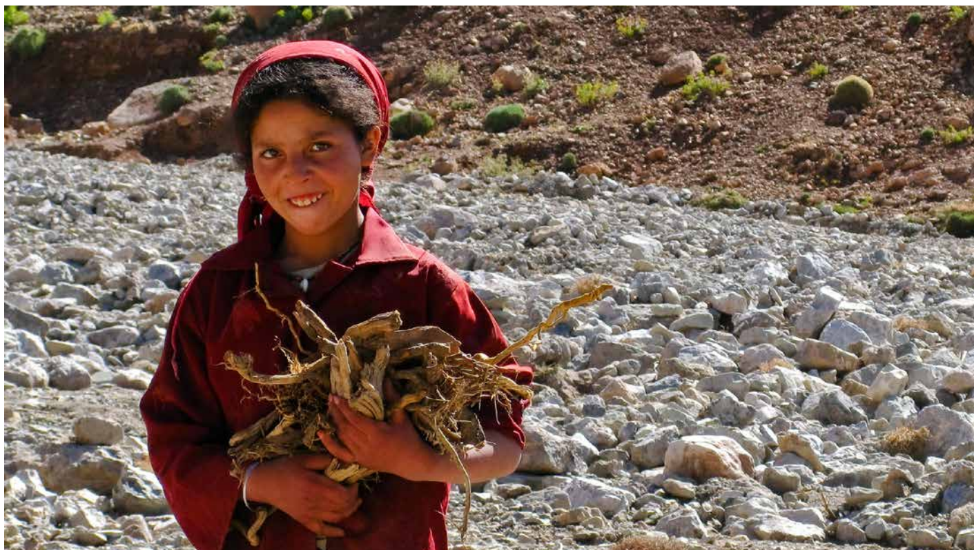
Berbermädchen im Hohen Atlas