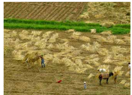
Getreideernte in Ait Bou Gmez