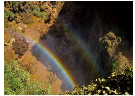
Bei den Wasserfällen von Ouzoud