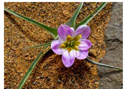
Beeindruckende Erdfarben im hohen Atlas