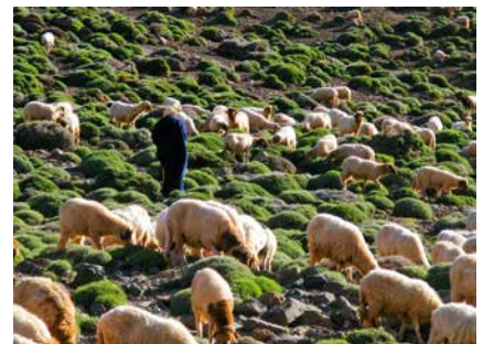
Unterwegs treffen wir Schäfer mit ihren Herden

Mobiltelefone/Strom: Im Hohen Atlas gibt es immer wieder Empfang (Roaming). Während der Tour gibt es keine Möglichkeiten, Fotoapparate oder Mobiltelefone aufzuladen. Wir empfehlen daher bei Bedarf die Mitnahme von Zusatzakku bzw. Powerbanks.