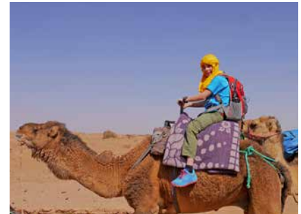
Hoch zu Dromedar