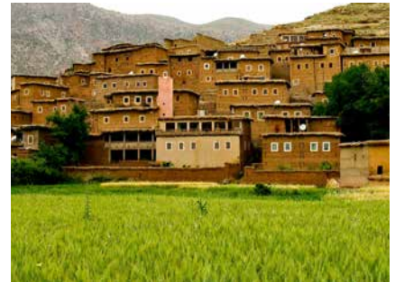
Im Tal von Ait Bou Gmez