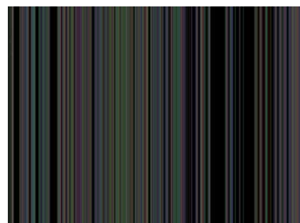
Der Djemma-el-Fna bei Nacht