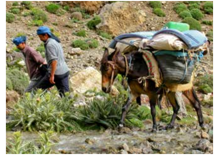
Maultiere sind in Marokko beliebte Helfer

Unser Reitesel steht für die Kinder zur Verfügung, um Teile der Etappen reitend zurückzulegen.