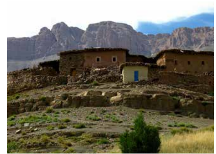
Berbersiedlung im Hohen Atlas

Können die Temperaturen in der Ebene um Marrakesch 40°C, östlich des Gebirges gar 50°C erreichen, ist es in den Bergen ab Höhen von 2000-2500 Meter warm bis angenehm kühl. Ist die Sonne verdeckt oder gar untergegangen kann es kalt werden, Nachtfrost auf Höhen ab 3500 Meter ist durchaus auch im Sommer üblich.