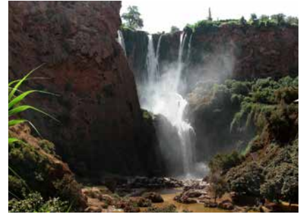
Die Wasserfälle von Ouzoud

Auch am Nachmittag genießen wir das idyllische Tal mit seinen terrasierten Feldern, Schafherden, Bächen und Wasserquellen. Nach etwa 2 Stunden Gehzeit nähern wir uns wieder unserem Dorf an, wo uns unsere Familienpension erwartet. Hier können wir uns waschen, eine kleine Siesta einlegen oder auch ein mitgebrachtes Kartenspiel bei Tee, Kaffee und Keksen spielen. Am Abend, gegen 18 Uhr, wird gemeinsam Abend gegessen und noch ein wenig Zeit in unserem Gemeinschaftsraum verbracht, bevor es zeitig ins Bett geht.