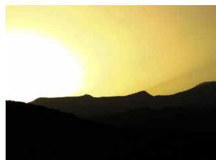
Sonnenuntergang in den marrokansichen Bergen