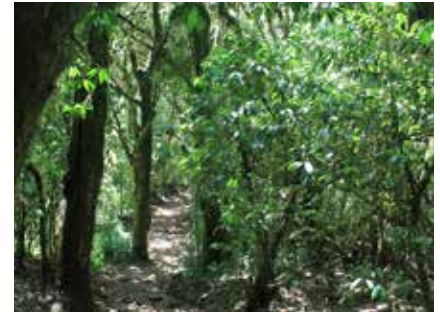
Im dichten Regenwald