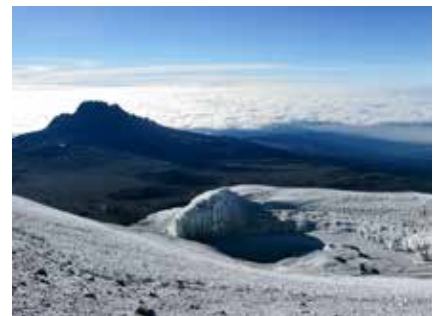
Crater Rim Gletscher am Kilimanjaro