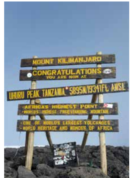
Der Uhuru Peak - höchster Punkt Afrikas

Sie können das Visum auch direkt am Flughafen ausstellen zu lassen. Aufgrund neuer Einreisebestimmungen kann dies jedoch etwas dauern.