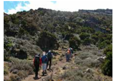
Aufstieg durch Heidwälder zum Shira Plateau

Nach der Gipfelrast steigt man wieder zum Barafu Camp ab, wo man sich nach den Strapazen erholen kann und ein frühes Mittagessen erhält. Anschließend wird zum letzten Lager für die Übernachtung weiter abgestiegen.