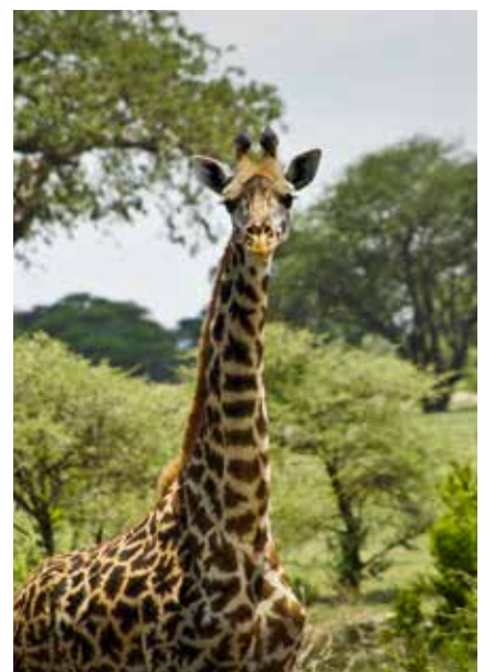
Giraffe im Tarangire Nationalpark