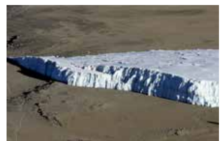
Gletscher im Krater