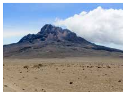
Blick auf den Mawenzi

Es gibt meist eine Suppe und anschließend ein Hauptgericht mit Reis, Nudeln, Kartoffeln oder Eiern in verschiedensten Variationen. Fleisch gibt es aufgrund der fehlenden Kühlkette meist nur während der ersten Tage.