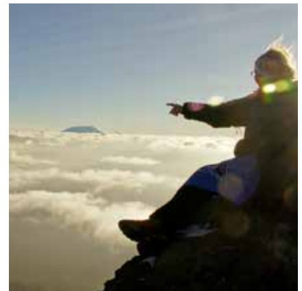
Blick auf den Kilimanjaro