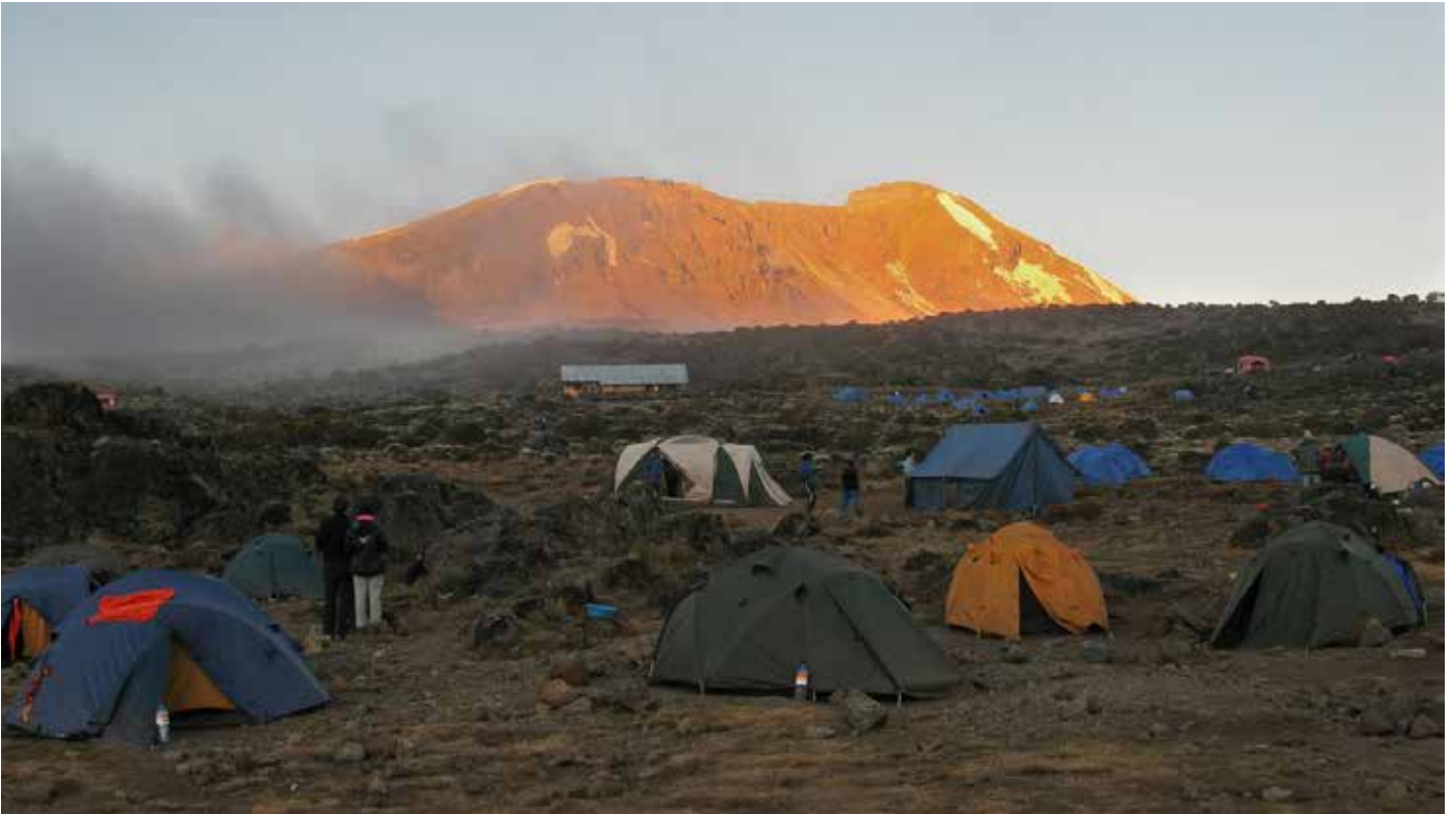
Blick vom Shira Plateau auf den Uhuru Peak (Machame Route)