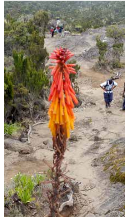
Durch die Heidewälder am Kilimanjaro

Die Ausfuhr der Landeswährung ist verboten, die Mitnahme von Fremdwährung ist bis zum bei der Einreise deklarierten Betrag erlaubt. Keine Beschränkungen sind hinsichtlich Waren bekannt. Die Ausfuhr von Gegenständen, die aus dem Material geschützter Tiere hergestellt sind und nicht den Vorschriften des Washingtoner Artenschutzabkommen entsprechen, ist verboten.