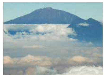
Blick auf den Mt. Meru