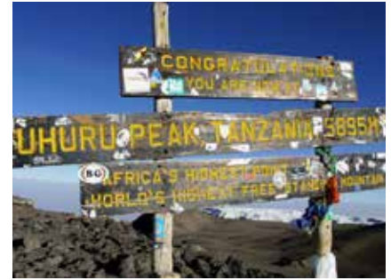
Gipfel des Kibo