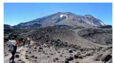
Am Shira Plateau