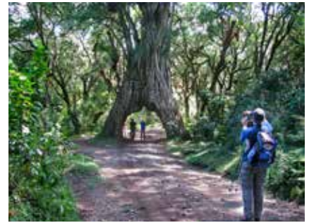
Fig Tree Arch im Arusha Nationalpark

Ein faszinierendes Naturschauspiel spielt sich alljährlich in der Serengeti ab: rund 1,2 Millionen Gnus, sowie 200.000 Zebras und 400.000 Gazellen, Topis und Antilopen, wandern in riesigen Herden, getrieben von der Suche nach nahrhaften Gräsern und legen dabei jährlich ca. 3.000 Kilometer zurück, wobei sie von Raubtieren gejagt werden.