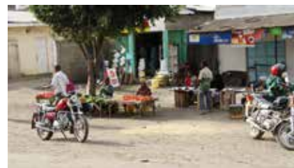
Marktstände entlang der Straße