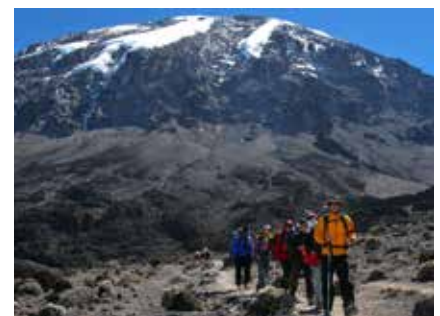
Aufstieg über die Machame Route