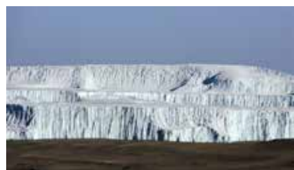
Gletscher im Krater