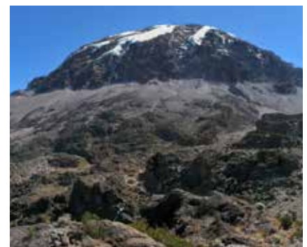
Der Kibo vom Karanga Valley