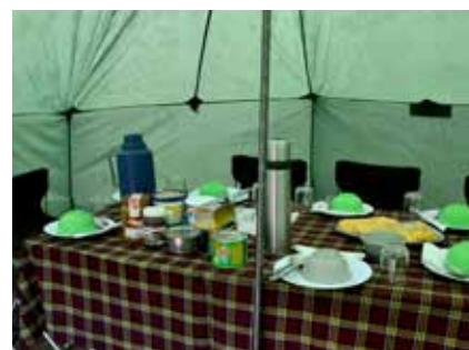
Frühstückstisch am Kilimanjaro