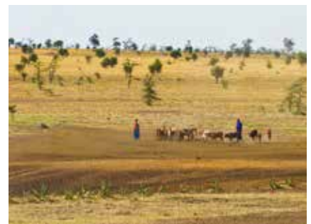
Massai Familie mit Ihren Rindern