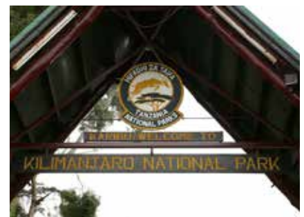
Beim Rongai Gate