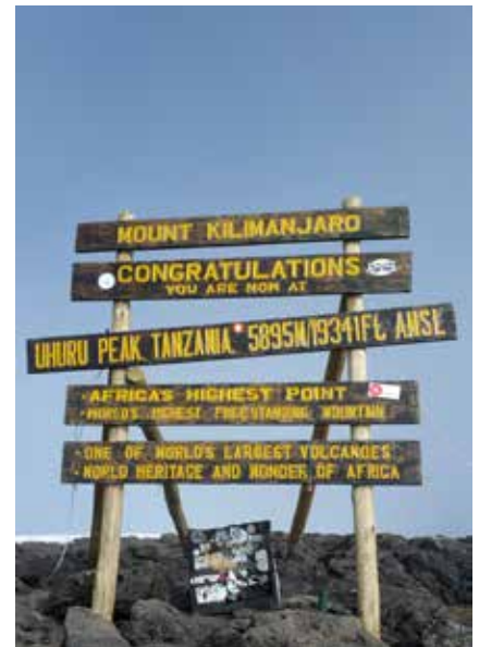
Der Uhuru Peak - höchster Punkt Afrikas

Sie können das Visum auch direkt am Flughafen ausstellen zu lassen. Aufgrund neuer Einreisebestimmungen kann dies jedoch etwas dauern.