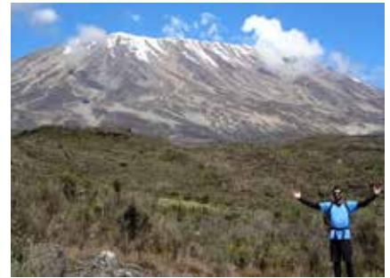
Alpine Moorlandschaft auf der Rongai Route

Mobiltelefone: Am Berg gibt es immer wieder Empfang (Roaming). Ihr Guide wird Ihnen auf Anfrage die entsprechenden Plätze gerne zeigen. Während der Tour gibt es keine Möglichkeiten, Fotoapparate oder Mobiltelefone aufzuladen. Wir empfehlen daher die Mitnahme von Zusatzakkus bzw. Powerbanks.