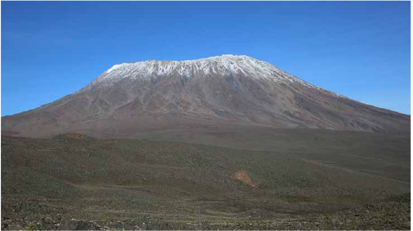
Die karge Nordseite des Kilimanjaro