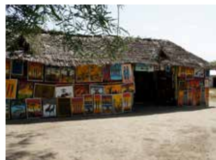
Art-Shop bei Moshi