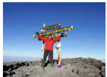
Am höchsten Punkt Afrikas