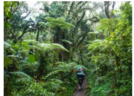
Aufstieg im Regenwald