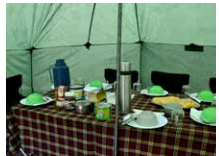
Frühstückstisch am Kilimanjaro