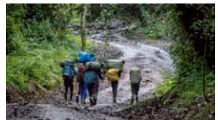
Abstieg zum Marangu Gate