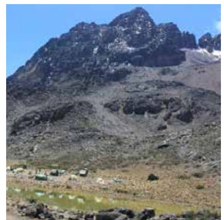
Mawenzi Tarn Camp