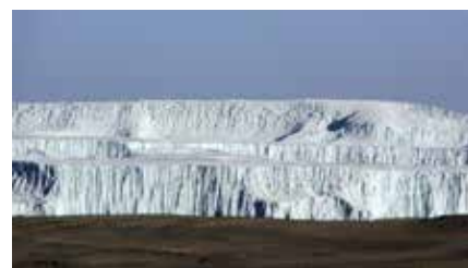
Gletscher im Krater