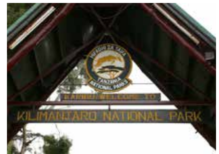
Beim Rongai Gate