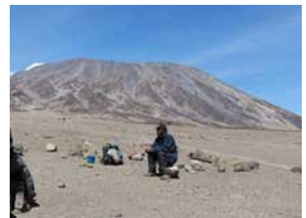
Die karge Nordseite