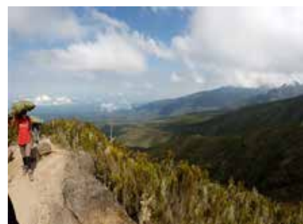
Ausblick auf die Heidewälder

Falls eine Gelbfiebersimpfung kontrolliert wird, zeigen Sie bitte ihr Flugticket vor, auf dem ersichtlich ist, dass Sie nur einen Transit-Aufenthalt unter 12 Stunden hatten.