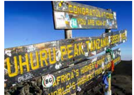
Am höchsten Punkt Afrikas