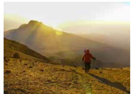
Sonnenaufgang über dem Mawanzi

Nach der Gipfelrast steigt man wieder zur Kibo Hut ab, wo man sich nach den Strapazen erholen kann und ein frühes Mittagessen erhält. Anschließend wird zum letzten Lager für die Übernachtung weiter abgestiegen.