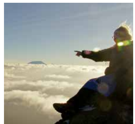
Blick auf den Kilimanjaro