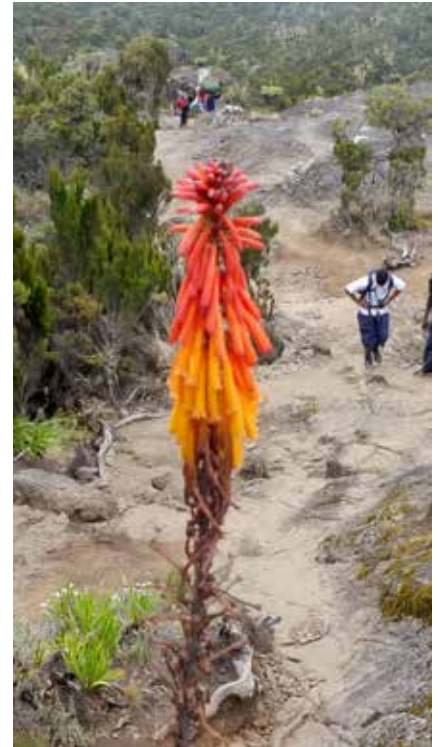
Durch die Heidewälder am Kilimanjaro

Die Ausfuhr der Landeswährung ist verboten, die Mitnahme von Fremdwährung ist bis zum bei der Einreise deklarierten Betrag erlaubt. Keine Beschränkungen sind hinsichtlich Waren bekannt. Die Ausfuhr von Gegenständen, die aus dem Material geschützter Tiere hergestellt sind und nicht den Vorschriften des Washingtoner Artenschutzabkommen entsprechen, ist verboten.