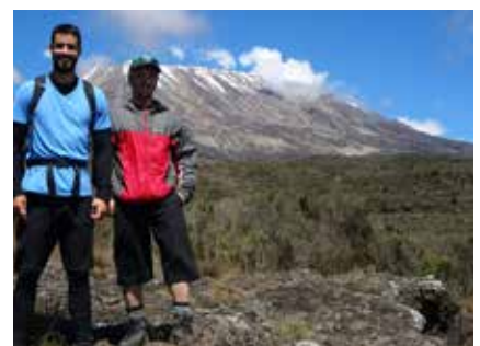
Aufstieg über die Rongai Route