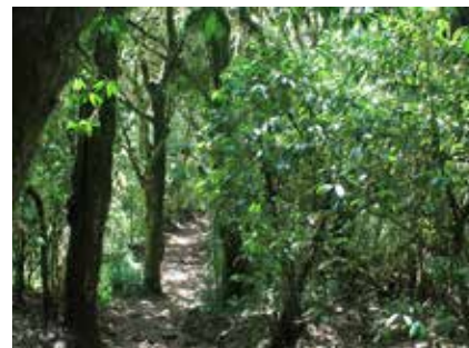
Im dichten Regenwald zum Simba Camp