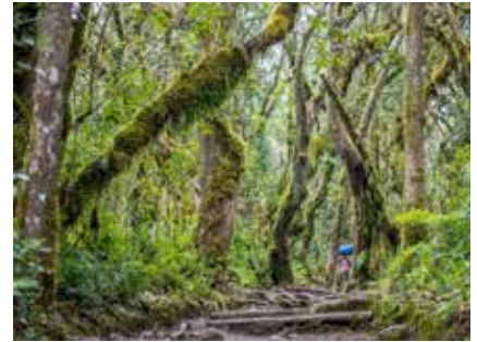
Im dichten Regenwald auf der Südseite

Kreditkartenzahlung: Die Bezahlung Ihrer Reise mit Kreditkarte ist prinzipiell möglich. Bitte beachten Sie, dass hier teilweise Spesen entstehen können. Bitte kontaktieren Sie uns diesbezüglich telefonisch.