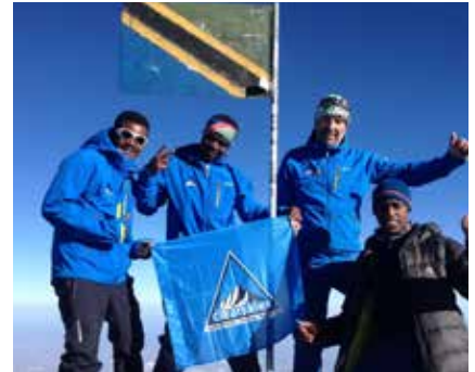
Bis bald in Tansania !