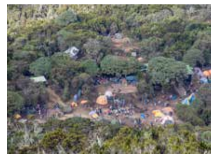
Die üppige Südseite am Kilimanjaro