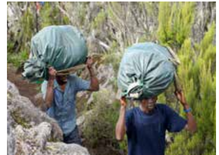
Porters am Kilimanjaro