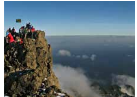
Am Gipfel des Mt. Meru