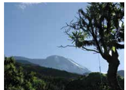
Massai Familie mit Ihren Rindern