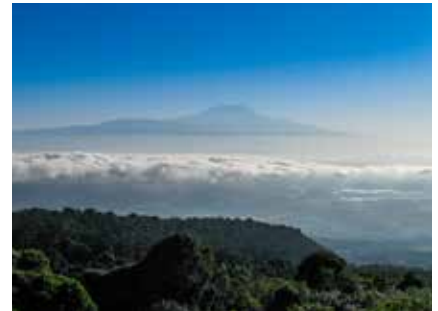
Der Blick auf den Kibo beim Aufstieg zum Mt. Meru