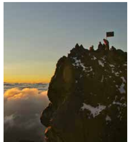
Sonnenaufgang am Mt. Meru