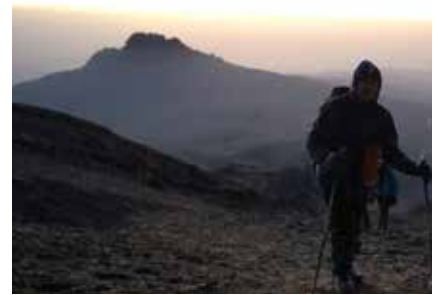
Aufstieg bei Dämmerung am Gipfeltag

Mobiltelefone: Am Berg gibt es immer wieder Empfang (Roaming). Ihr Guide wird Ihnen auf Anfrage die entsprechenden Plätze gerne zeigen. Während der Tour gibt es keine Möglichkeiten, Fotoapparate oder Mobiltelefone aufzuladen. Wir empfehlen daher die Mitnahme von Zusatzakkus bzw. Powerbanks.