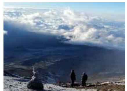
Blick vom Barranco Camp auf den Kibo