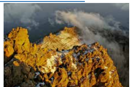
Blick vom Gipfel des Mt. Meru