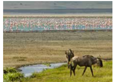
Gnus und Flamingos im Tarangire Nationalpark

Während der Safari wird in komfortablen 4*Lodges übernachtet. Die Lodges sind in traditionellem Stil gehalten und verfügen über Terrassen und weitläufige Restaurants inklusive Bar mit Blick auf die Wildnis der Nationalparks. In den Restaurants wird abwechslungsreich gekocht, die Gerichte sind dem europäischen Gaumen angepasst. Nach einem Tag voller Eindrücke lässt es sich dort gut entspannen. Einige Lodges sind mit einem Swimmingpool ausgestattet. Jedes Zimmer verfügt über ein eigenes Badezimmer mit Dusche und WC, es gibt meist kostenfreies W-LAN.