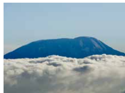
Kilimandscharo vom Mt. Meru