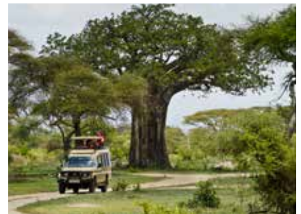
Unterwegs auf Safari