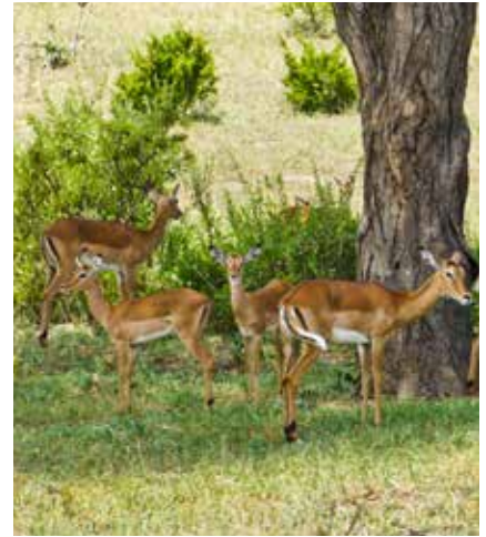
Der Uhuru Peak - höchster Punkt Afrikas

Sie können das Visum auch direkt am Flughafen ausstellen zu lassen. Aufgrund neuer Einreisebestimmungen kann dies jedoch etwas dauern.