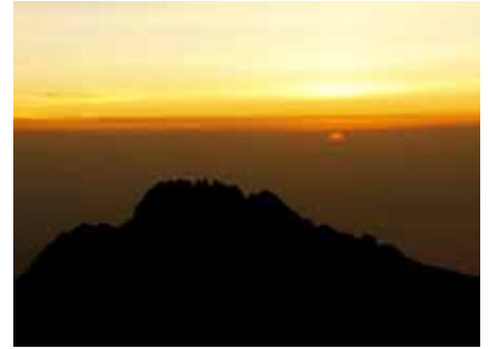
Sonnenaufgang am höchsten Punkt Afrikas

Nach der Gipfelrast steigt man zum letzten Lager ab, wo man sich nach den Strapazen etwas erholen kann. Anschließend wird zum nächsten Lager für die Übernachtung weiter abgestiegen.