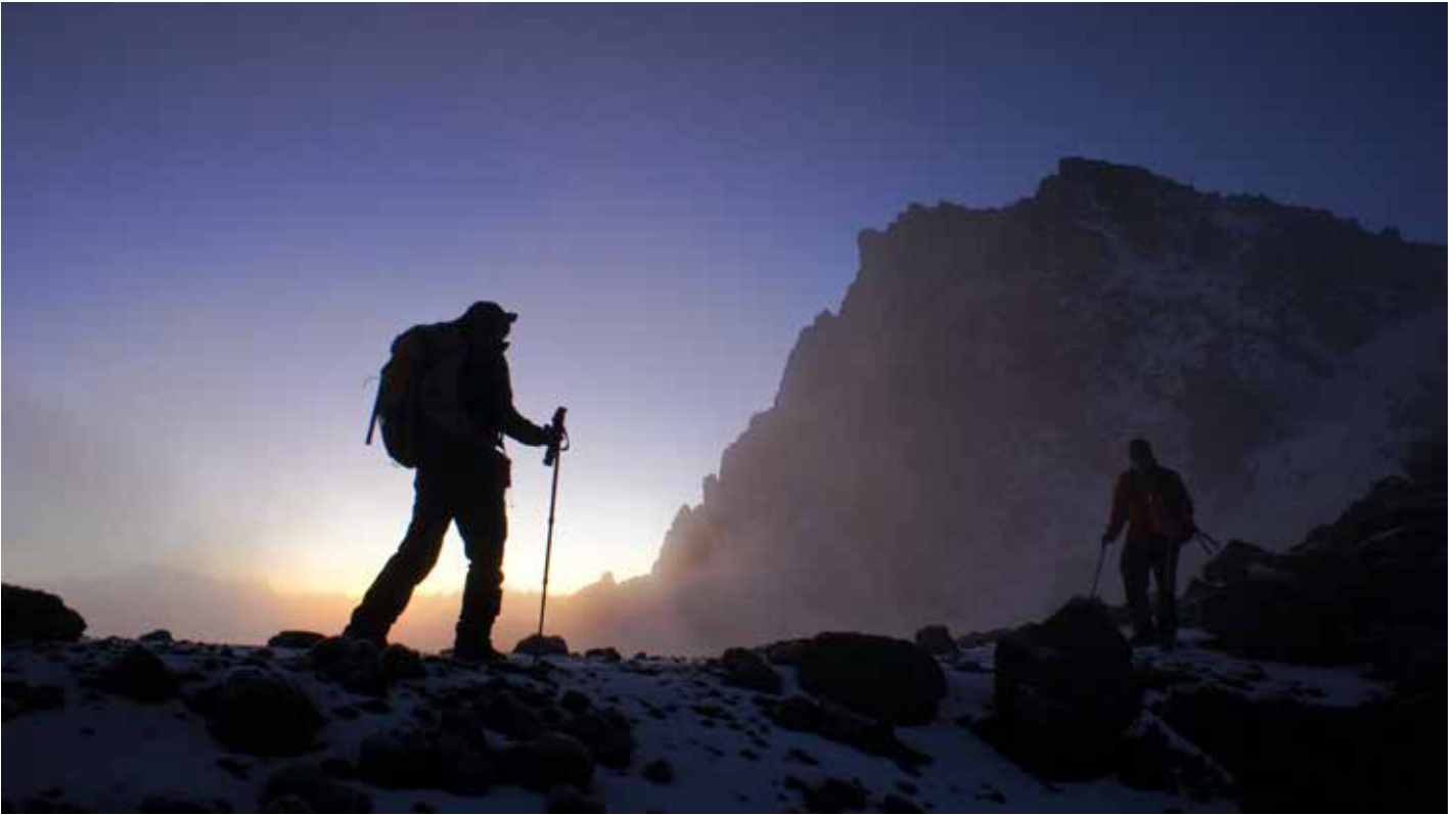
Bei Morgenstimmung auf dem Weg zum Mount Meru

Mit optimaler Höhenakklimatisierung auf den Kilimanjaro