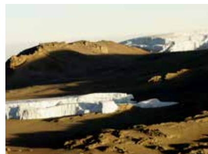
Gletscherreste in der Morgensonne