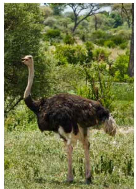
Vogel Strauß im Lake Manyara Nationalpark