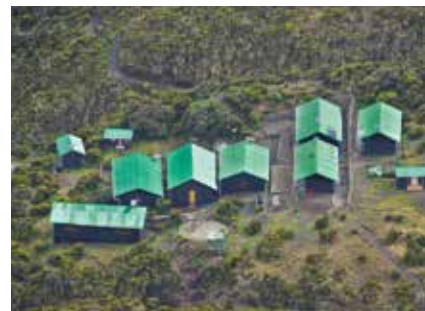
Blick auf die Saddle Hut am Mt. Meru