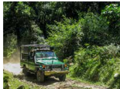
Auf dem Weg Ausgangspunkt für den Kilimandscharo

Im Abstieg kann man gut über Schotterreisen abkürzen. (Ein Tipp: Leichte Gamaschen schützen vor Steinen in den Schuhen).