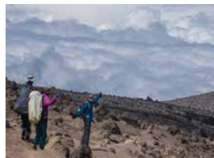
Mächtige Wolkenstimmungen am Aufstieg zum Kili