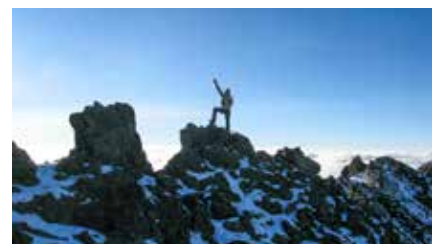
Am Mt. Meru