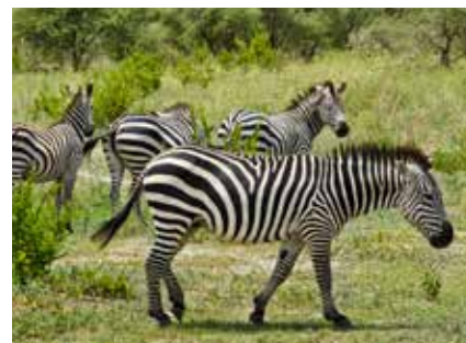
Zebras aus nächster Nähe im Lake Manyara NP

Es gibt meist eine Suppe und anschließend ein Hauptgericht mit Reis, Nudeln, Kartoffeln oder Eiern in verschiedensten Variationen. Fleisch gibt es aufgrund der fehlenden Kühlkette meist nur die ersten Tage.