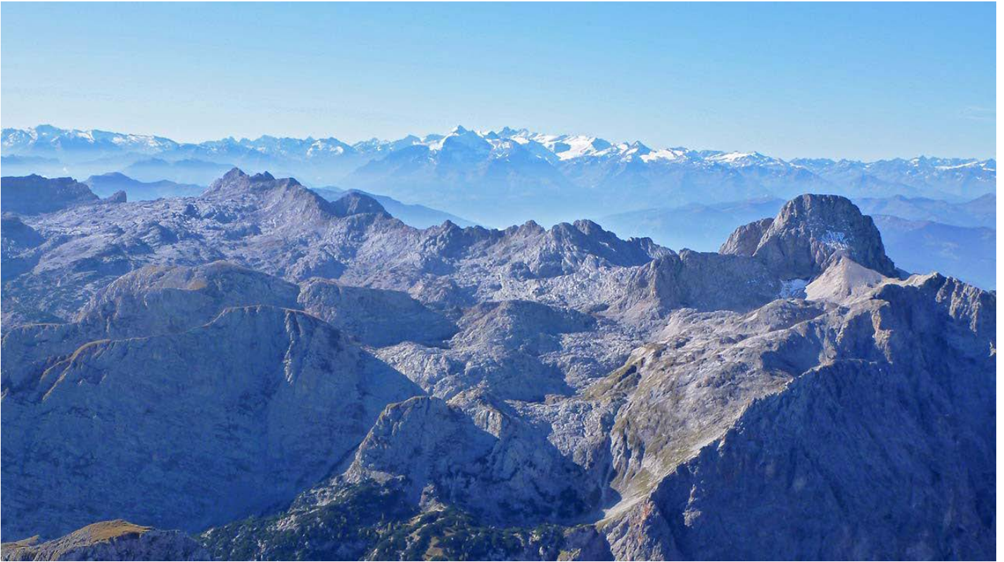
Das Steinerne Meer

Watzmann-Besteigung & Wanderung vom Königssee zum Steinernen Meer