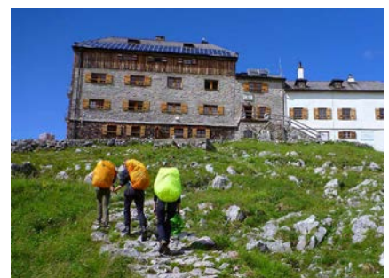
Im Aufstieg zum Watzmannhaus