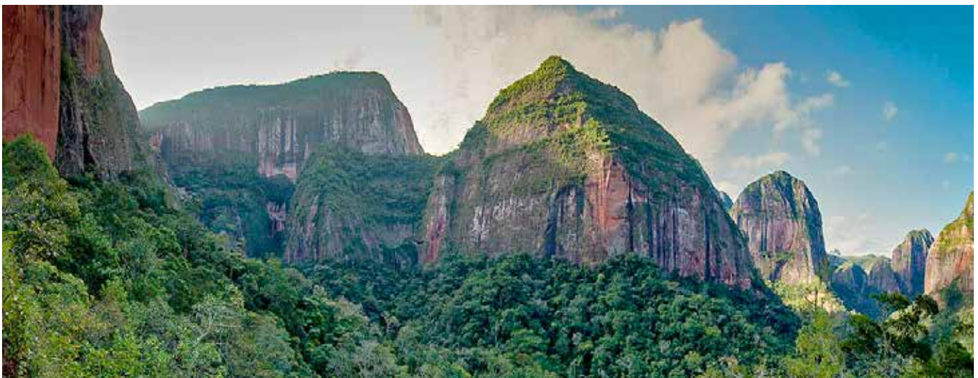
Im Ambooro Nationalpark