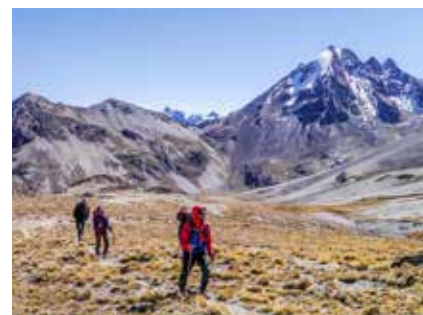
Trekking in der Königskordillere