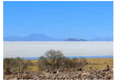
Die Weite der Salzwüste von Uyuni

Teilweise werden Euro akzeptiert, allerdings zu schlechteren Kursen. Kreditkarten, v. a. Visa, werden inzwischen vielerorts akzeptiert und mit Kredit- oder Maestro-Karte kann man in allen größeren Städten Geld in der Landeswährung abheben. Während der Reise benötigt man hauptsächlich Kleingeld, da in kleineren Läden und auf Märkten aufgrund eines Mangels an Wechselgeld keine größeren Scheine akzeptiert werden.