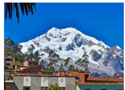
Der Blick vom Bergdorf Sorata