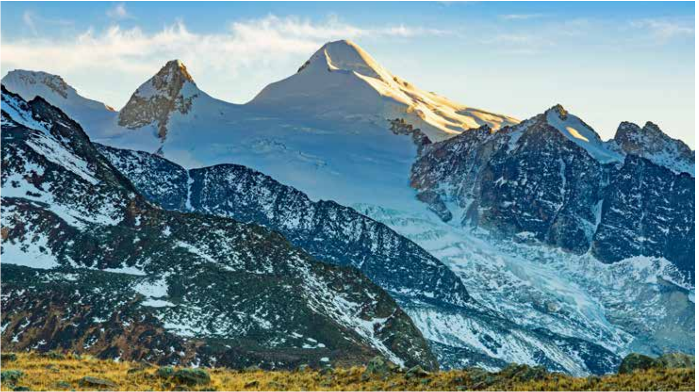
In der vergletscherten Cordillera Real