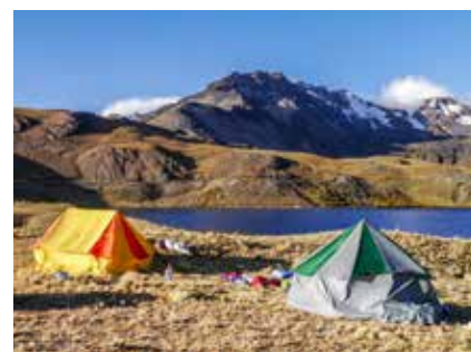
Zeltlager in der Königskordillere