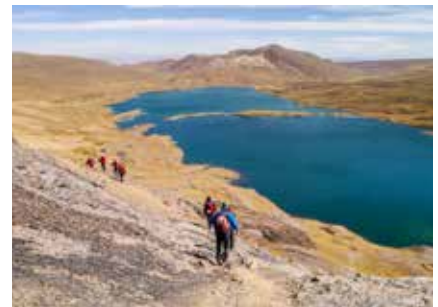
Trekking in der Königskordillere