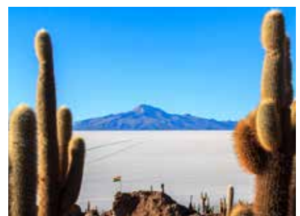
Die Isla Incahuasi