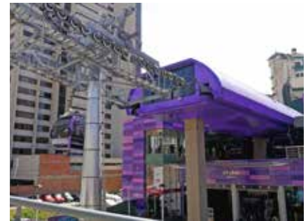
Die Seilbahnen von La Paz

Bitte beachten Sie: Einerseits summieren sich die Anstrengungen im Laufe der Reise, andererseits bieten sich mehrere Tage zur Akklimatisierung (Stadtbesichtigung La Paz, Ausflug zum Titicacasee) und zur Regeneration (Fahrtage, Besichtigungstage). Nur mit entsprechender Höhenakklimatisierung lässt sich das gesamte Trekking genießen.