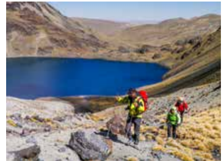
Trekking in der Königskordillere

Am besten können Sie sich mit Ausdauertraining vorbereiten: regelmäßiges Laufen (Joggen), Radfahren, lange Bergtouren mit normalem Tagesgepäck (ca. 6 bis 10 Kg) bereiten Sie am ideal auf diese Tour vor.