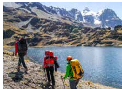
In der Cordillera Real