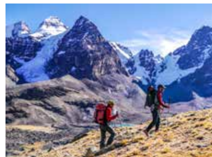
In der Cordillera Real