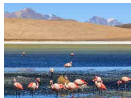
Im Avaora Nationalpark