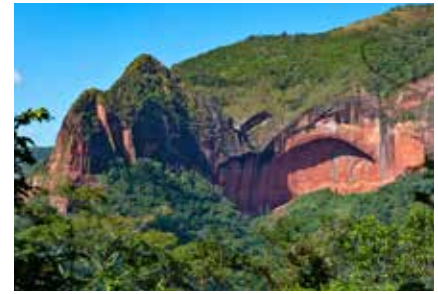
Sandsteinfelsen im Amboro Nationalpark