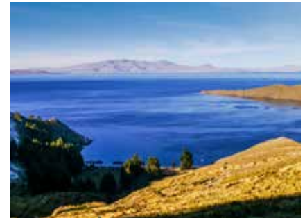
Am Titicaca See