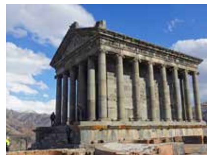
Der hellenistische Tempel von Garni

In die Reiseapotheke gehören jedenfalls Medikamente gegen Durchfall, Antibiotika, Lotion gegen Insekten, Sonnenschutzmittel und Verbandszeug. Beachten Sie bitte, dass die medizinische Versorgung in Georgien nicht dem westlichen Standard entspricht und berücksichtigen Sie das bitte bei Ihrem Versicherungsschutz für die Reise. Bitte lassen Sie sich in jedem Fall von Ihrem Arzt beraten.