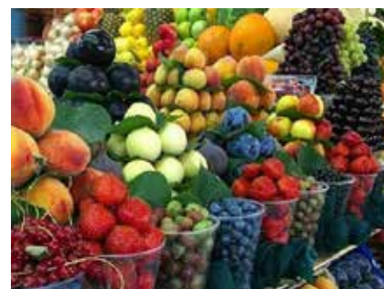
Am Markt in Jerewan