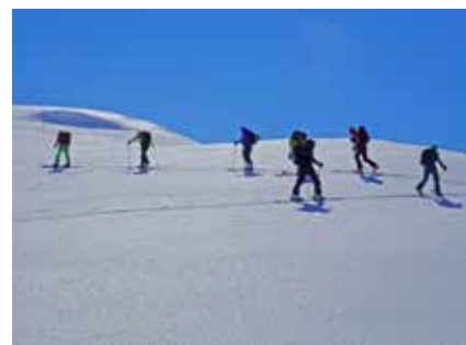
Im Aufstieg auf den Egiatrush