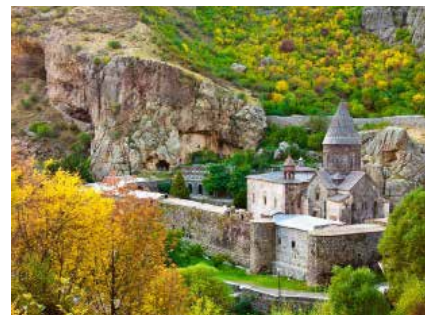
Das Kloster Geghard

Der Reisepass muss mindestens sechs Monate nach Ausreise gültig sein.