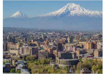
Jerewan und der heilige Berg Ararat