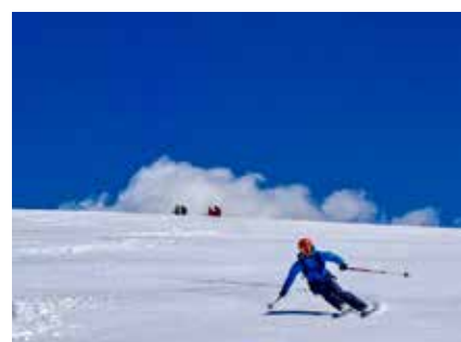
Rassige Abfahrten im kleinen Kaukasus