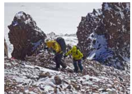
Die letzten Meter auf den Gipfel des Aragats

Am besten können Sie sich mit Ausdauertraining vorbereiten: regelmäßiges Laufen (Joggen) und lange Skitouren mit normalem Tagesgepäck (ca. 6 bis 10 Kg) bereiten Sie am besten auf diese Tour vor.