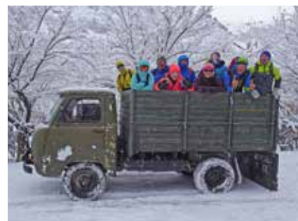
Improvisierter Transport zur Skitour