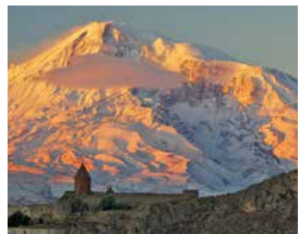
Ararat und das Kloster Chor Virap