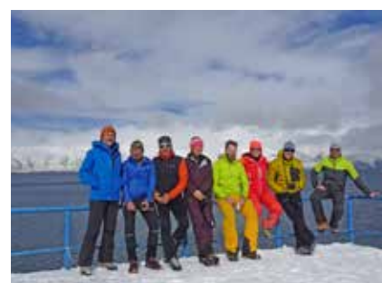
Am großen Sewansee