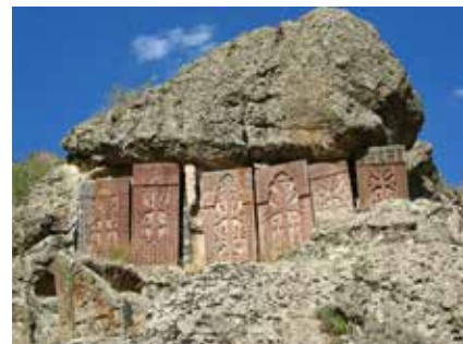
Kreuzsteine beim Kloster geghard