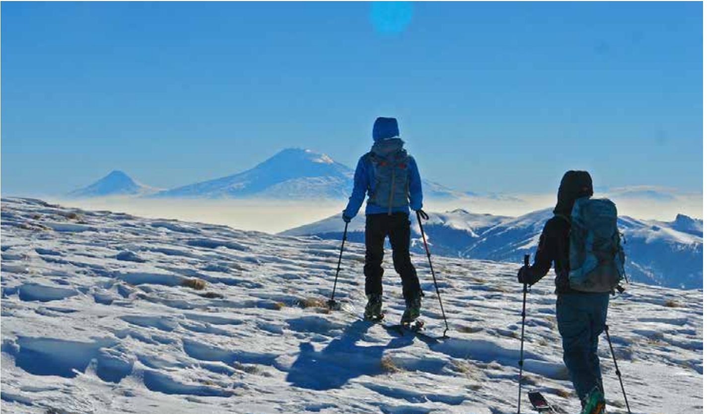
Blick auf den Ararat