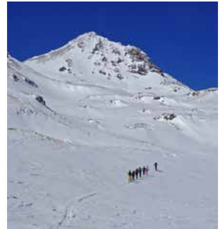
Aufstieg auf den Aragats

Für diese Reise ist sehr gute Kondition erforderlich und wird vorausgesetzt.