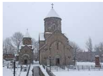
Kirche bei Teghenis